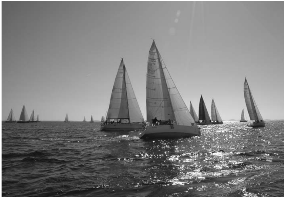
Start zur ersten Wettfahrt

Mit energiegeladenen Schnappschüssen der spannenden Rang-