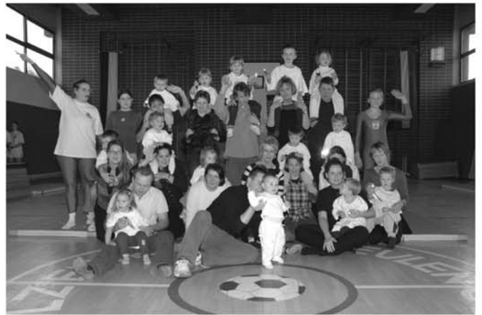
Turnsaal der HS Neulengbach, 4. Dezember 2005