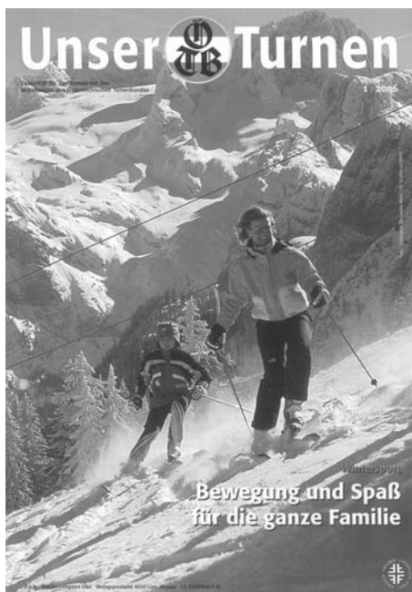
Titelseite von „Unser Turnen, 1 – 2006“

Ich möchte daher, nachdem ich mich mit diesem Thema etwas näher befasst habe, die Möglichkeit nutzen,