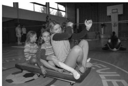
Ausbruch aus Alcatrace

Für die Kinder bildete der Ausklang der Vorweihnachtsfeier durch den Besuch von Knecht Ruprecht mit seinem prall gefüllten Sack den Höhepunkt des Nachmittags.