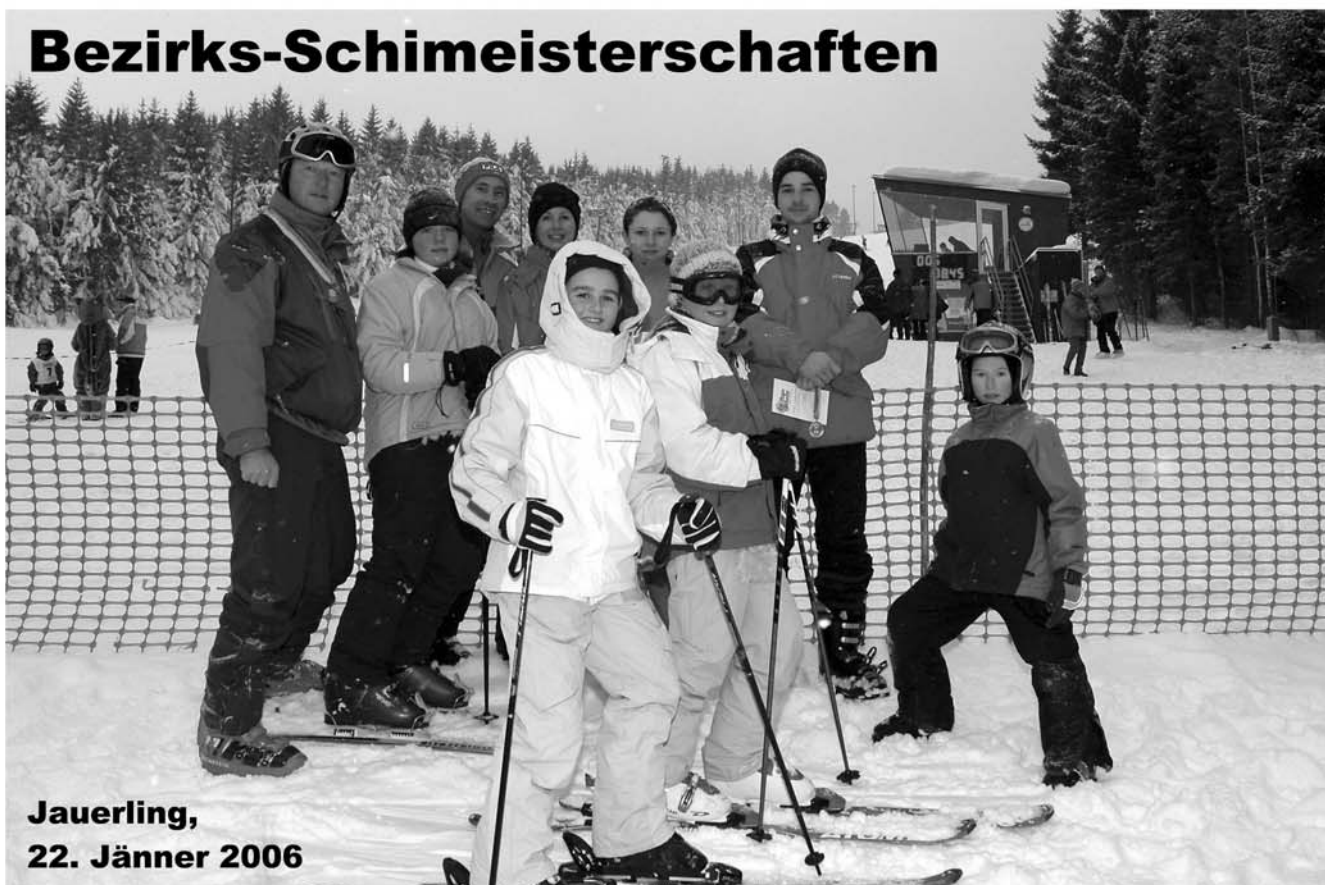
Jauerling, 22. Jänner 2006