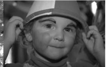
Faschings- fest im Turnerheim 18. Februar 2006