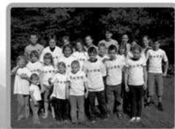
komm' mit uns mit!