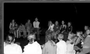
Lagerfeuerrunde und Spaß werden größer mit jedem Kind -