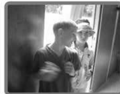
Wir suchen DICH!