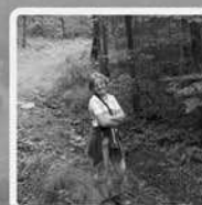
Bei Schwimmen und Wandern bleiben wir fit.