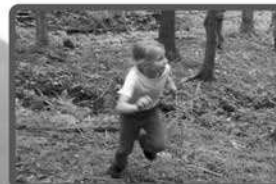
D'rum lauf' nicht weg,