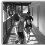
Wo bist du denn?

Mobil: 0664/428 41 30 Fax.: 02772/55 424-14