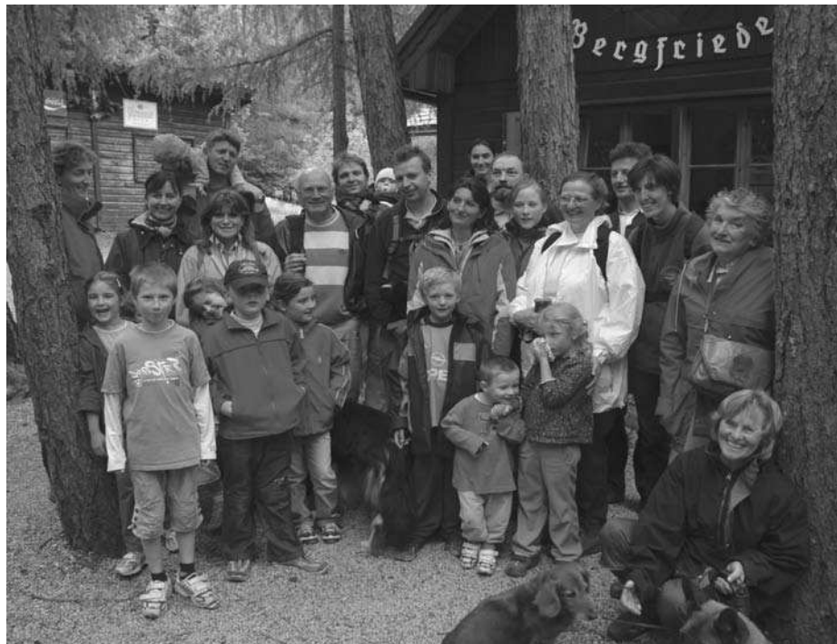
Die „Frühlingswanderer“ vor der Staffhütte