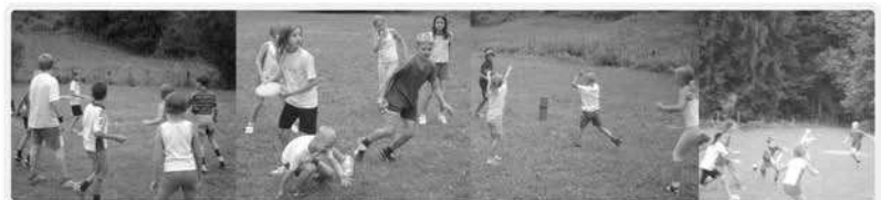
Spannende Spiele interessieren dich doch sicherlich.