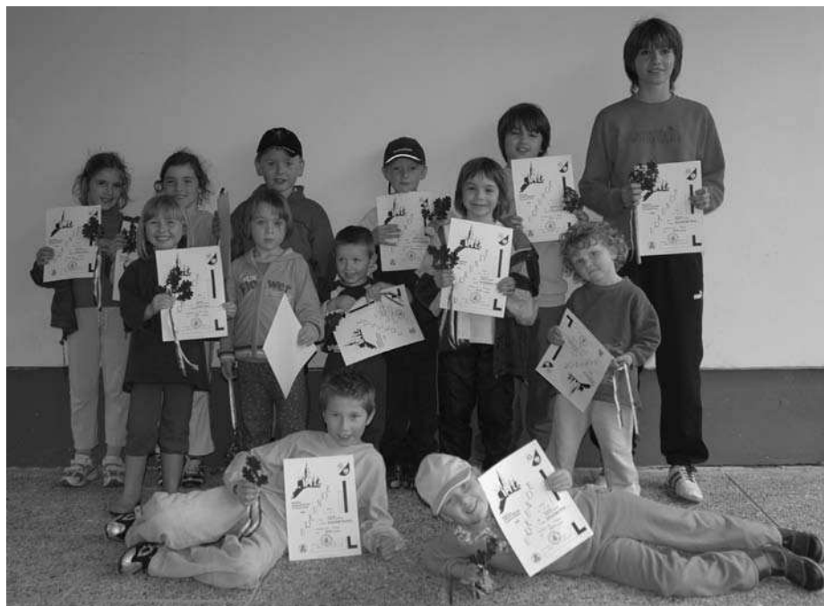
Unsere Mannschaft beim Bezirkskindertreffen in Krems