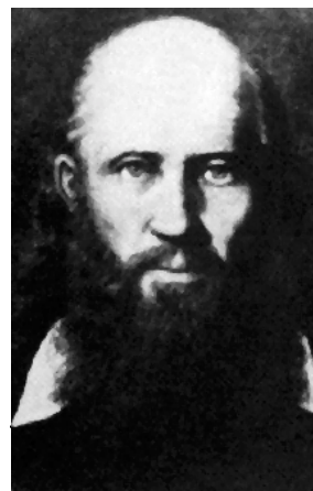
Friedrich Ludwig Jahn

achtet, ist in der Lage, auch anderen Völkern die ihnen zustehende Achtung entgegenzubringen.